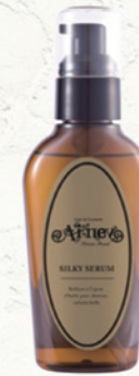
アイニー シルキーセラム (洗い流さないヘアトリートメント) NET.100mL/¥2,800(税別)