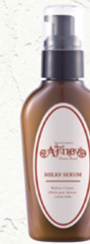
アイニー ミルキーセラム (洗い流さないヘアトリートメント) NET.100g/¥2,800(税別)